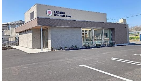
さくらトータルケアクリニック